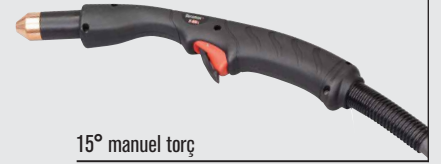
15° manuel torç