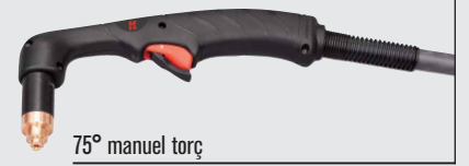
75° manuel torç

(daha fazla torç seçeneği için, bkz: www.hypertherm.com )